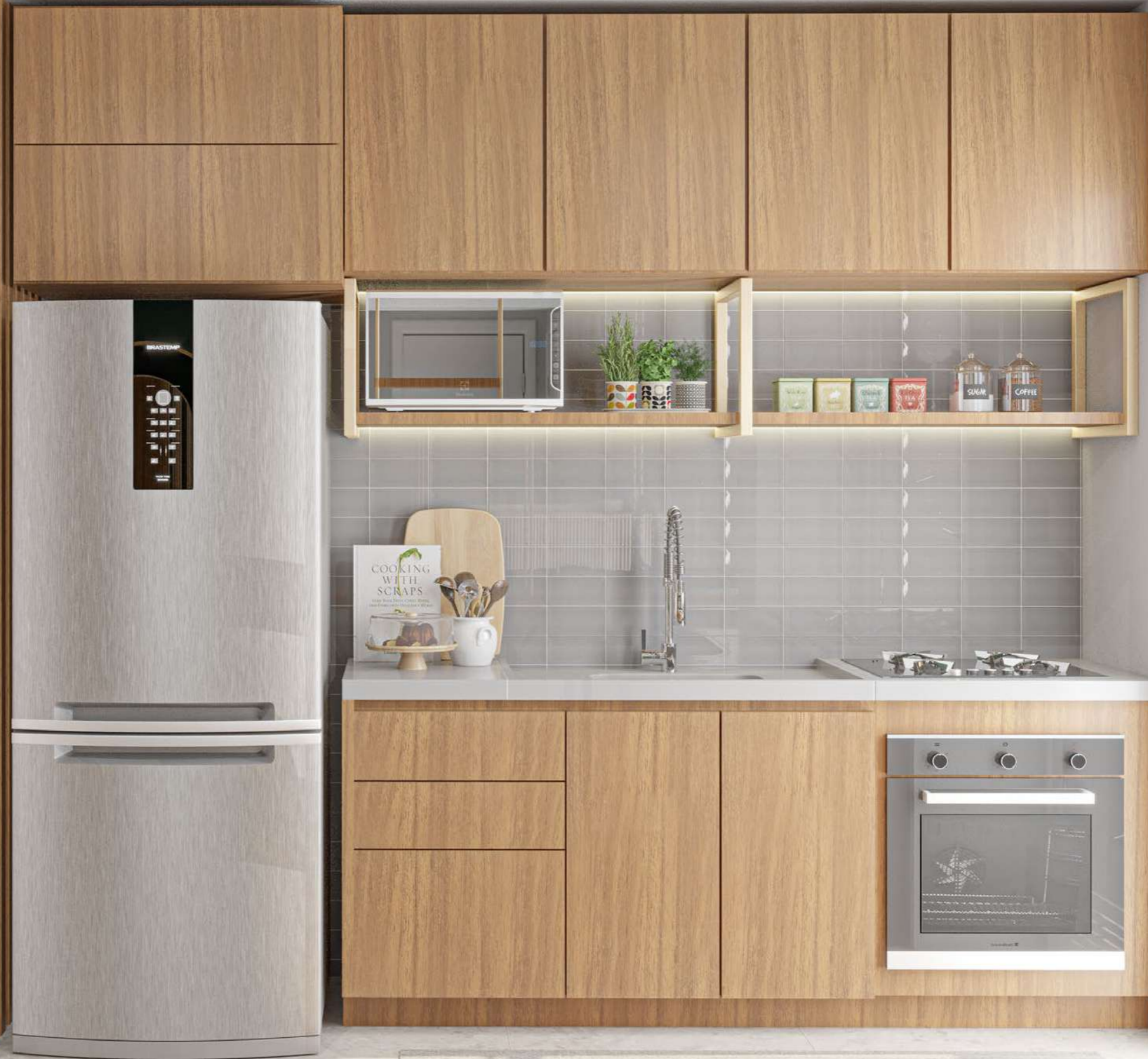
Perspectiva ilustrada do COZINHA do apto tipo A Garden de 52,66 m 2