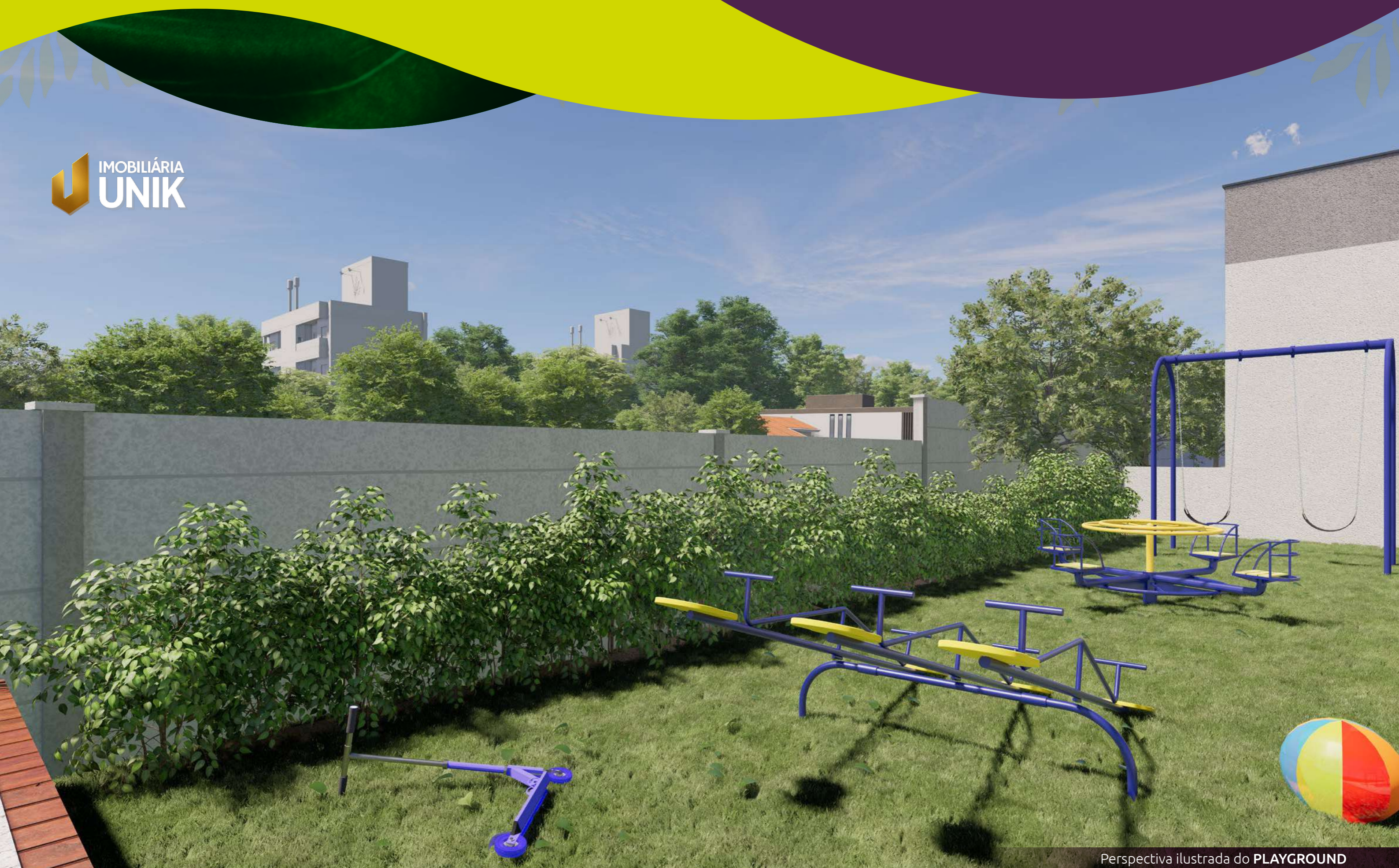
Perspectiva ilustrada do PLAYGROUND