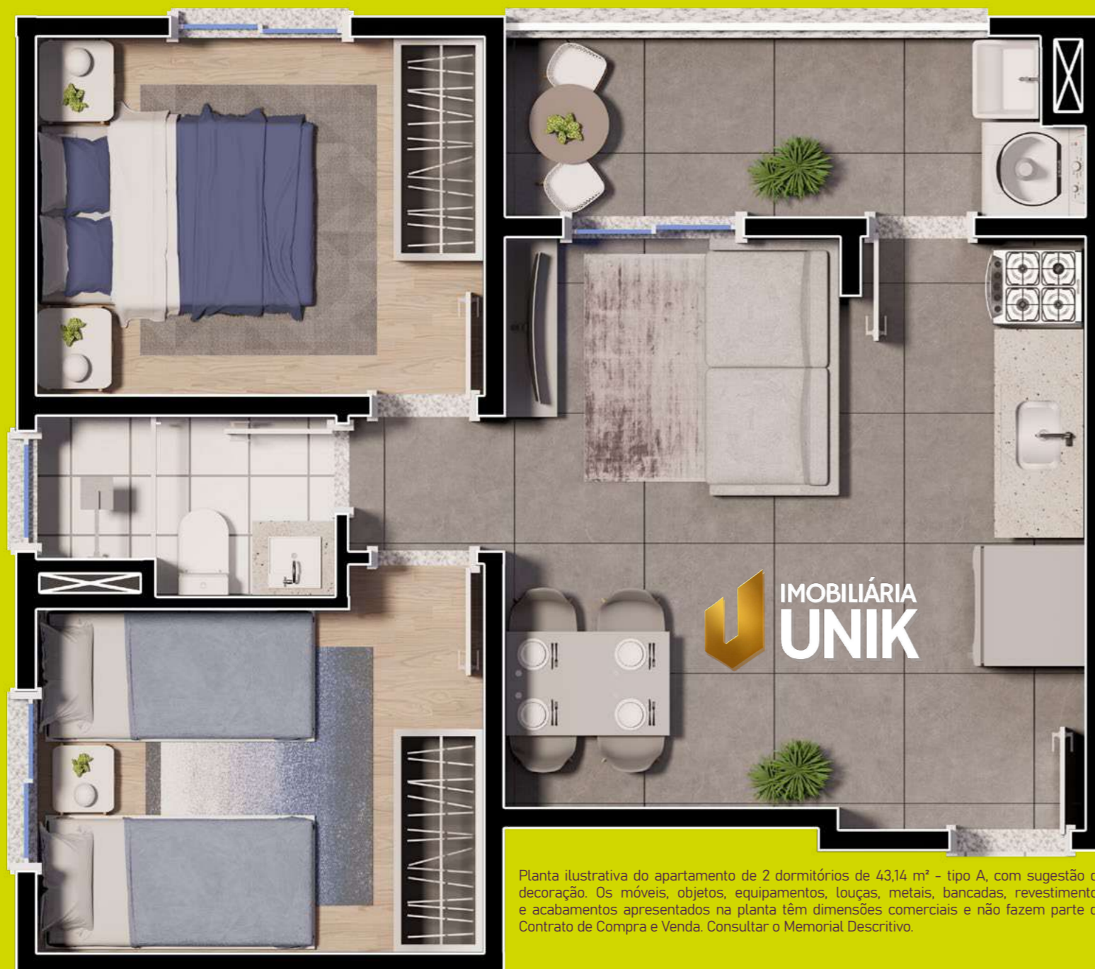
Planta ilustrativa do apartamento de 2 dormitórios de 43,14 m 2 - tipo A, com sugestão de decoração. Os móveis, objetos, equipamentos, louças, metais, bancadas, revestimentos e acabamentos apresentados na planta têm dimensões comerciais e não fazem parte do Contrato de Compra e Venda. Consultar o Memorial Descritivo.