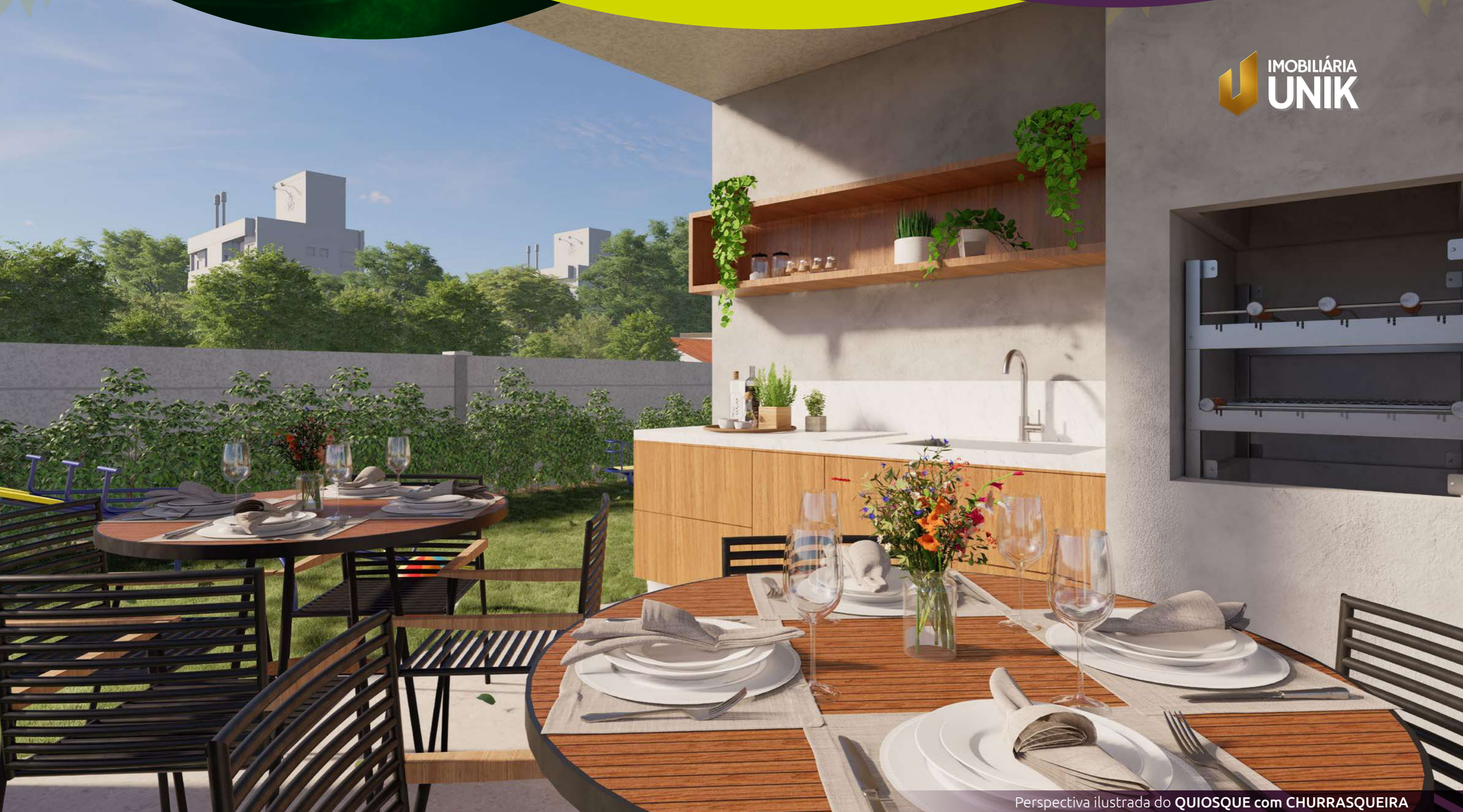
Perspectiva ilustrada do QUIOSQUE com CHURRASQUEIRA