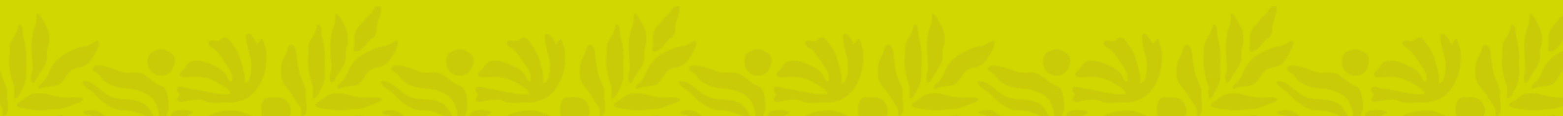
Imagem meramente ilustrativa. O projeto será entregue de acordo com o memorial descritivo e o contrato assinado pelo comprador.