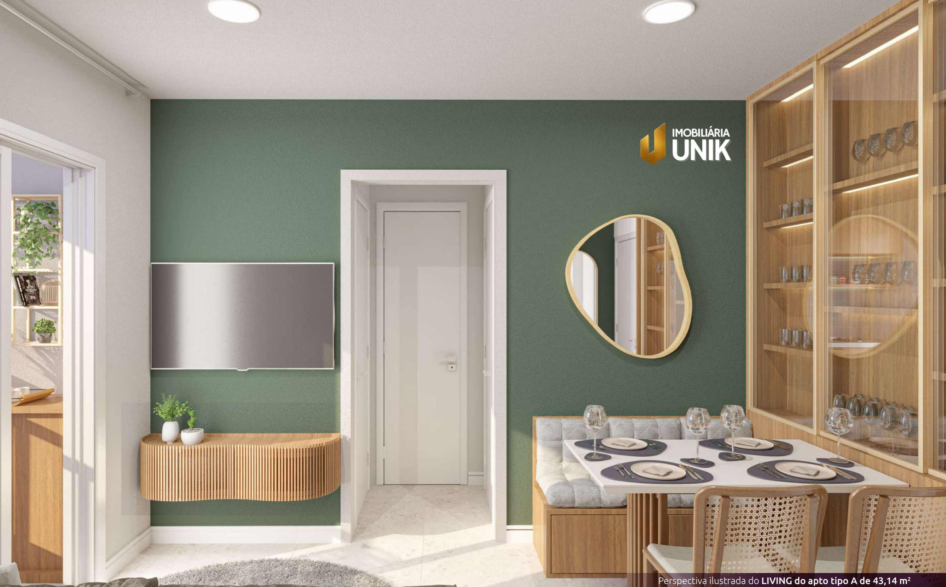
Perspectiva ilustrada do LIVING do apto tipo A de 43,14 m 2