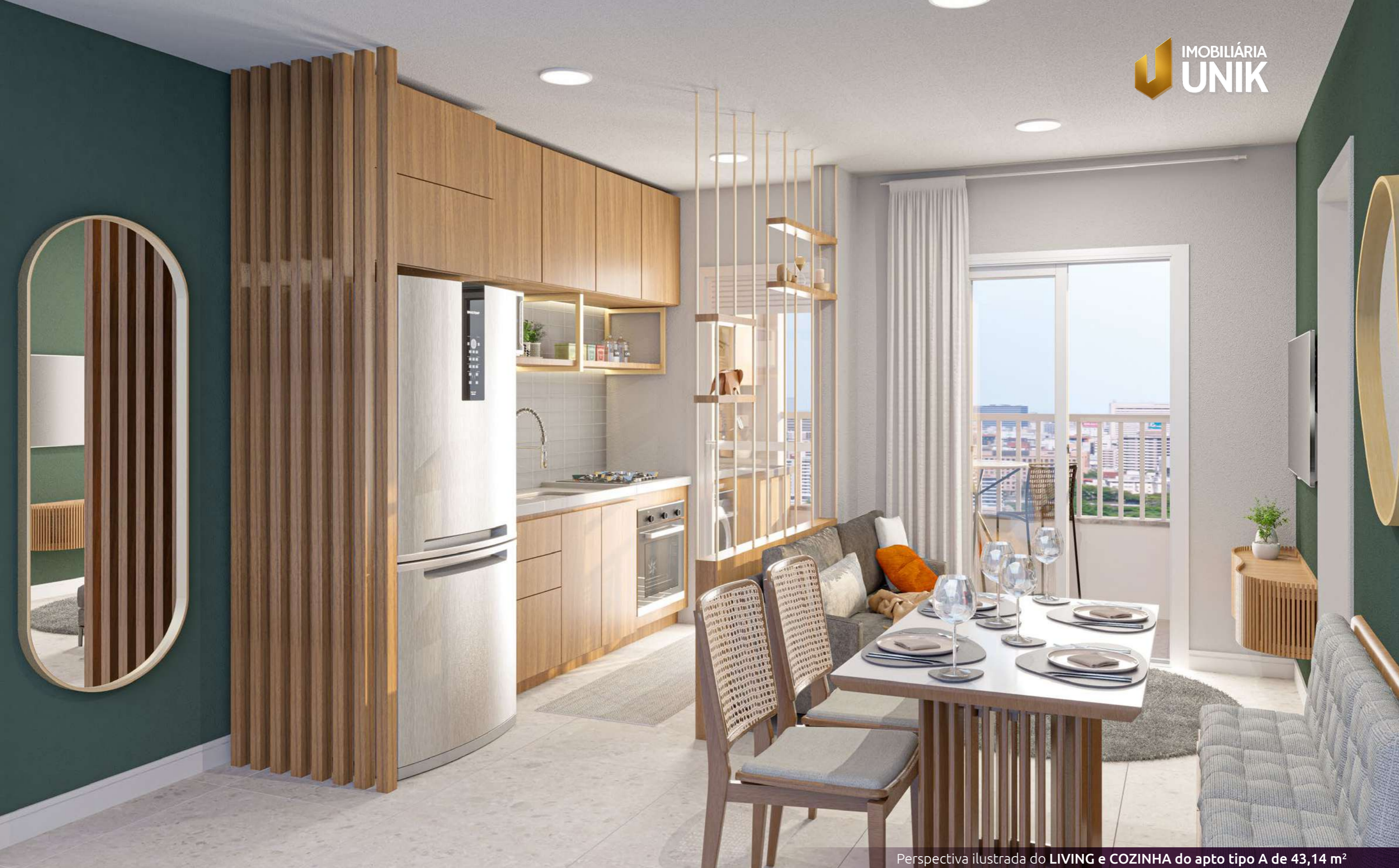
Perspectiva ilustrada do LIVING e COZINHA do apto tipo A de 43,14 m 2