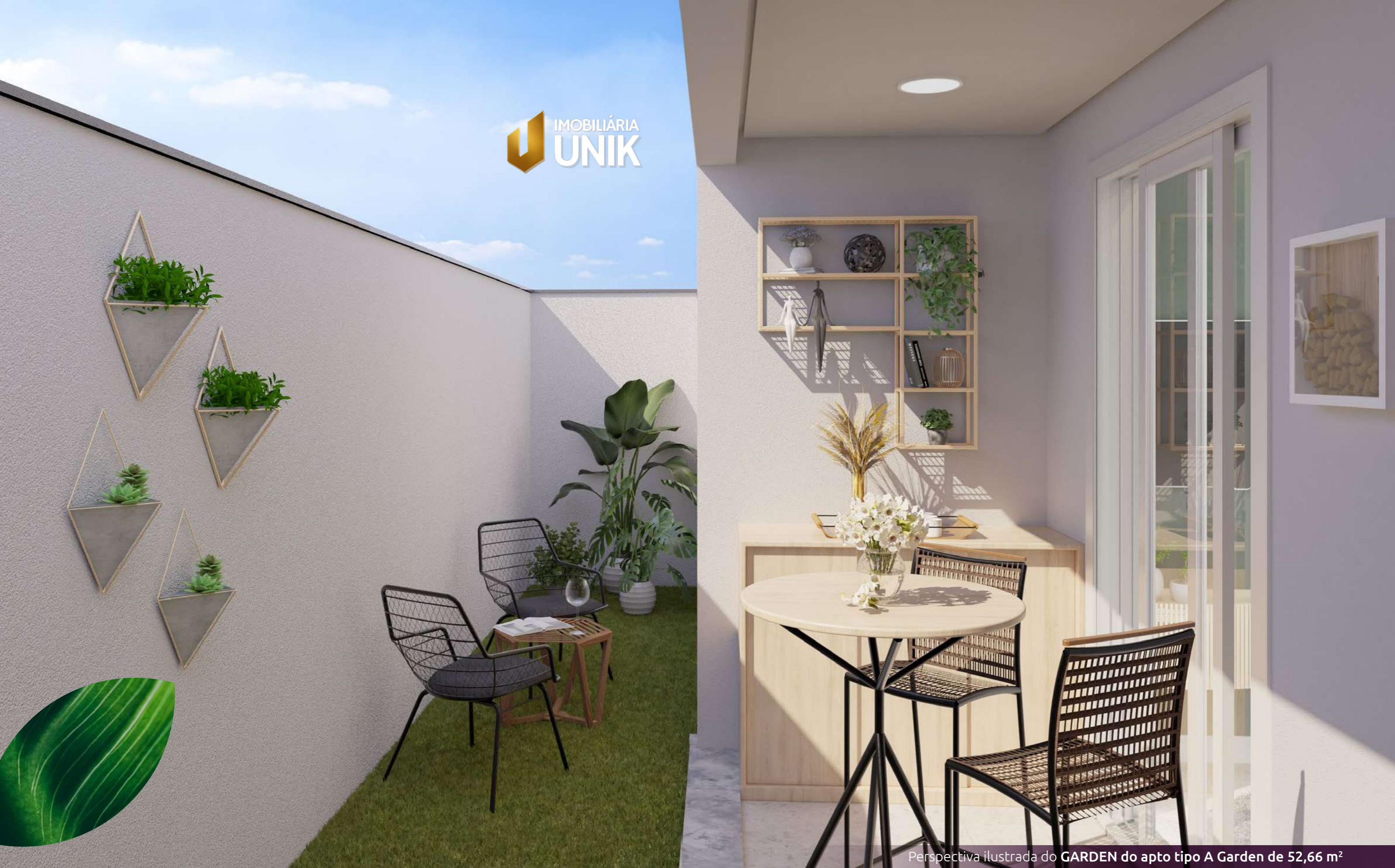
Perspectiva ilustrada do GARDEN do apto tipo A Garden de 52,66 m 2