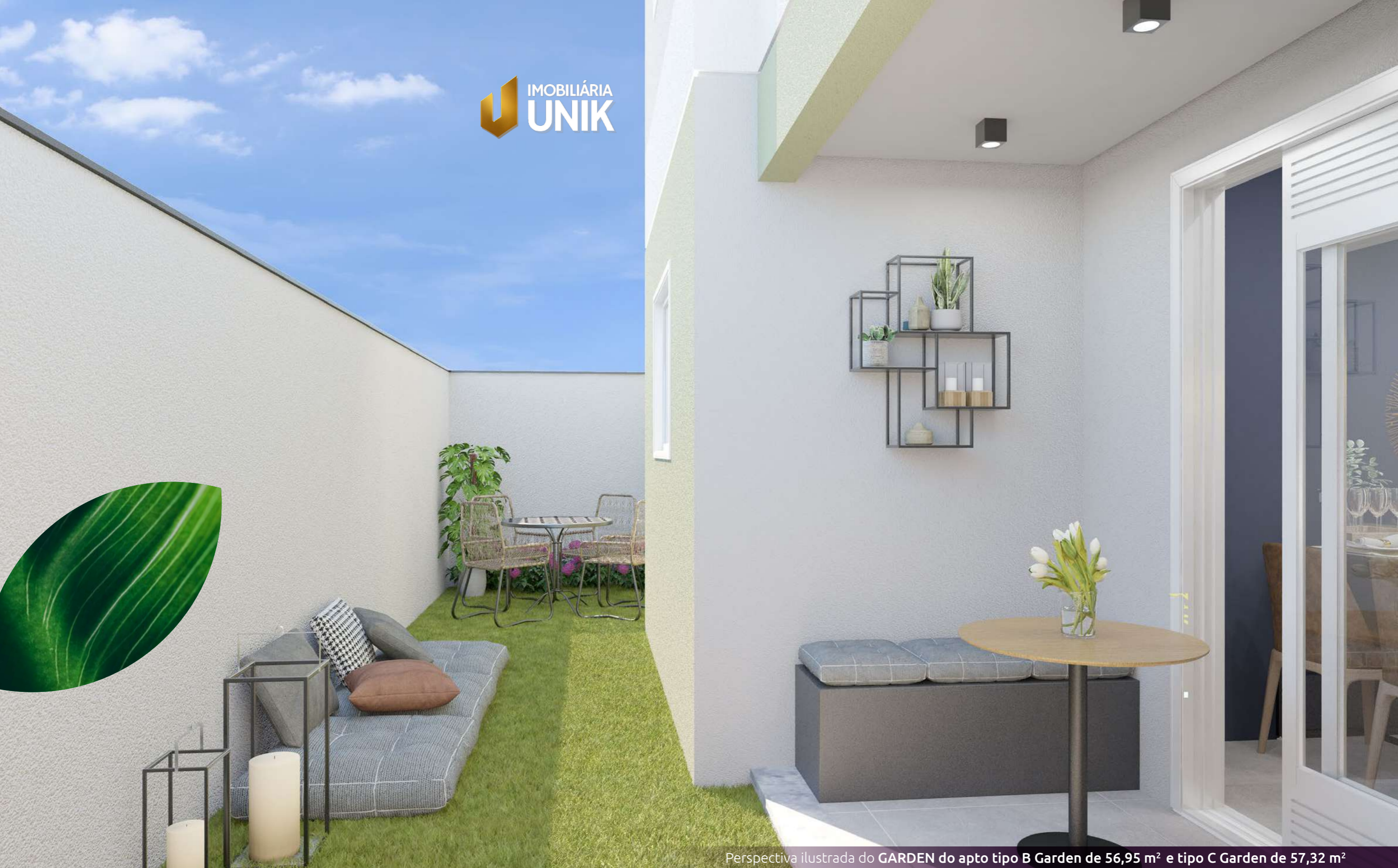
Perspectiva ilustrada do GARDEN do apto tipo B Garden de 56,95 m 2 e tipo C Garden de 57,32 m 2

Imagem meramente ilustrativa. O projeto será entregue de acordo com o memorial descritivo e o contrato assinado pelo comprador.