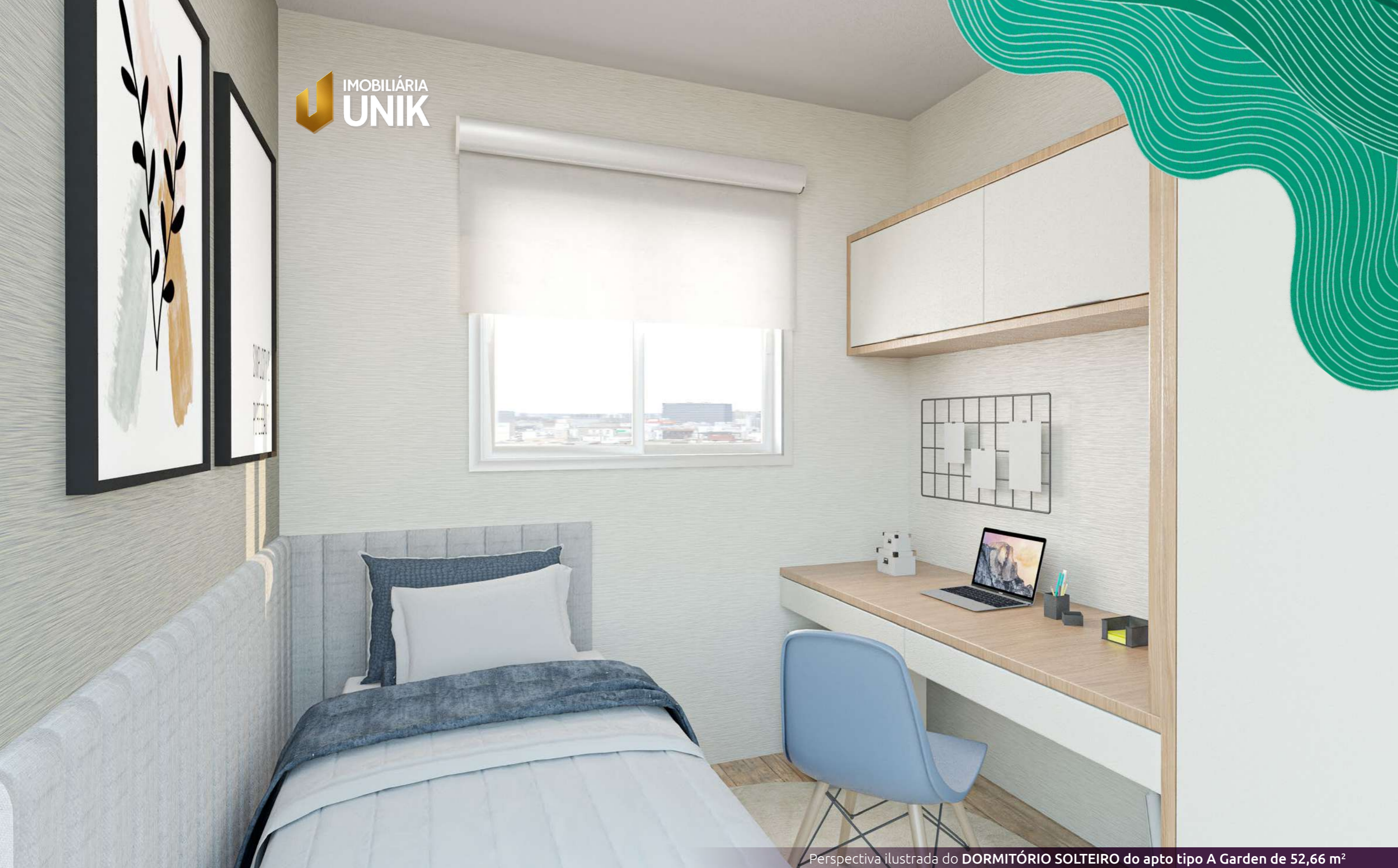
Perspectiva ilustrada do DORMITÓRIO SOLTEIRO do apto tipo A Garden de 52,66 m 2