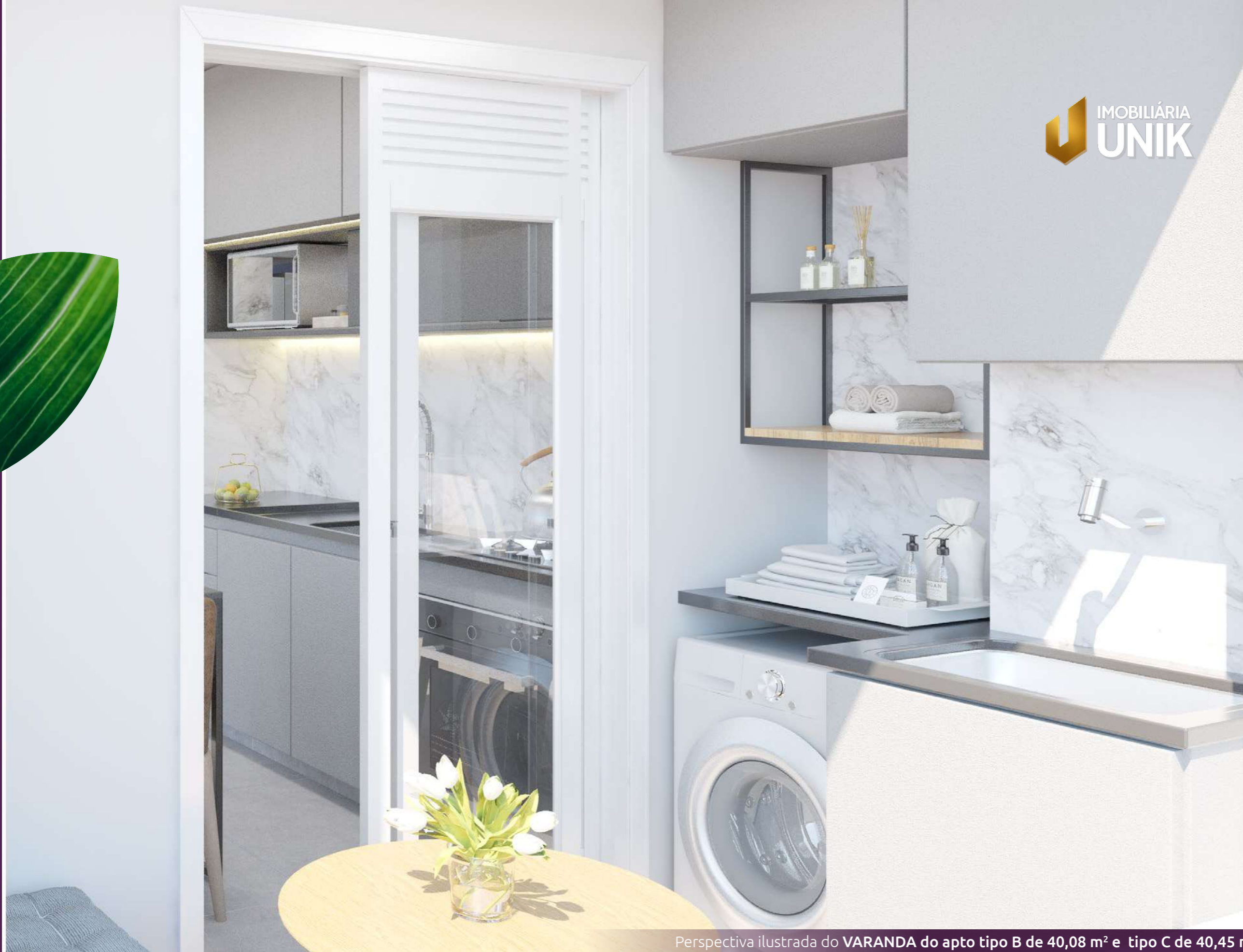
Perspectiva ilustrada do VARANDA do apto tipo B de 40,08 m 2 e tipo C de 40,45 m 2